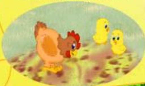
КУРИЦА И ЦЫПЛЯТА