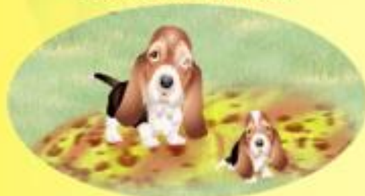
СОБАКА И ЩЕНОК