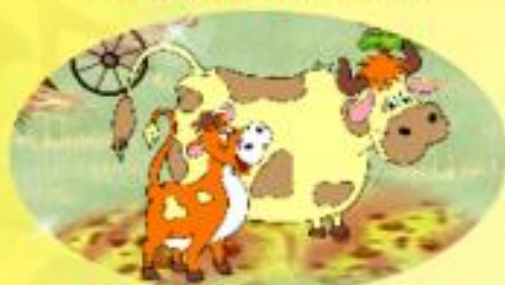
КОРОВА И ТЕЛЁНОК