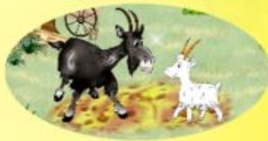
КОЗА И КОЗЛЁНОК