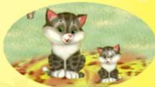
КОШКА И КОТЁНОК