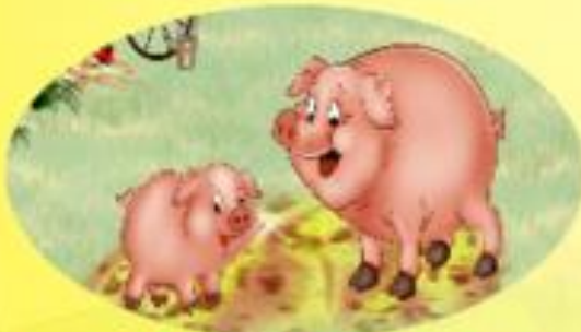
СВИНЬЯ И ПОРОСЁНОК