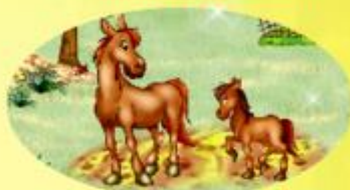
ЛОШАДЬ И ЖЕРЕБЁНОК